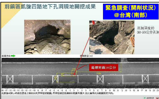
台湾南部の都市で緊急調査箇所