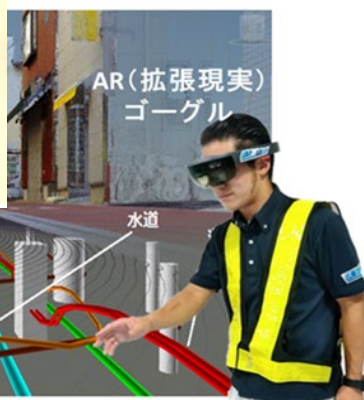
2020年12月地上・地下インフラ 3D マップ® (DUOMAP®) が 世界発信コンペティション (東京都ベンチャー技術大賞) にて 特別賞受賞