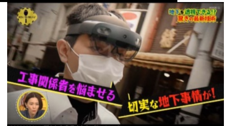
2020年8月NHK 「所さん！大変ですよ」に出演