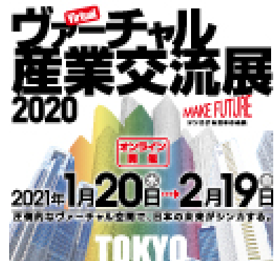
2021年1月東京都主催の ヴァーチャル産業交流展に出展