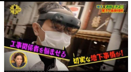
2020年8月NHK 「所さん！大変ですよ」に出演