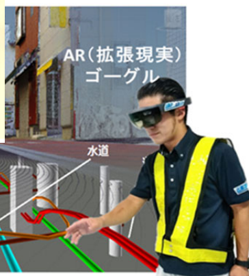
2020年12月地上・地下インフラ 3D マップ® (DUOMAP®) が 世界発信コンペティション (東京都ベンチャー技術大賞) にて 特別賞受賞