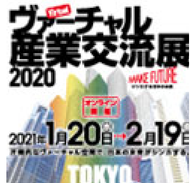
2021年1月東京都主催の ヴァーチャル産業交流展に出展