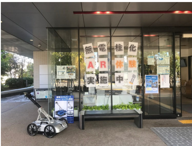
2020年11月10日無電柱化の日 芦屋市で無電柱化の日イベント開催

ジオ・サーチは、「チーム・GENSAI」として今後も皆様の命と暮らしを守るために調査を続けてまいります。